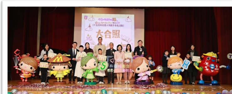
《大俠夢》全體演員與主禮嘉賓合照