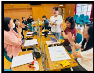
老師、家長及同學齊投入參與課堂